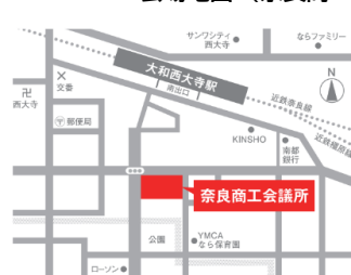
会場地図(奈良商工会議所)