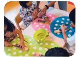
県産木材で作る 『マイ箸作り体験』

工房うるはし 参加費 中学生以上:1,000円 3歳~小学生:500円 約1時間/各回12名まで ①10:30~②12:30~ ③14:00~④15:30~ ※当日10時以降会場で随時申し込みを受け付けます。