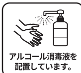
アルコール消毒液を配置しています。