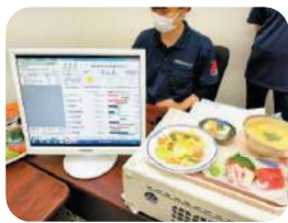
食育SATシステム体験 栄養相談 沖縄県栄養士会