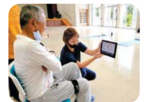
DEIGOS 女子サッカー選手と測定しよう! 『体力測定』 エナジック琉球デイゴス

工房うるはし 参加費 中学生以上:1,000円 3歳~小学生:500円 約1時間/各回12名まで ①10:30~②12:30~ ③14:00~④15:30~ ※当日10時以降会場で随時申し込みを受け付けます。