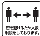
密を避けるため人数制限をしております。

「RICCA」は、沖縄県の公式LINEアカウントを利用した新型コロナウイルス感染者情報等のお知らせ機能です。多くの県民の皆様のご利用をお願いします。 RICCAへのご登録はこちら (LINE友だち登録)