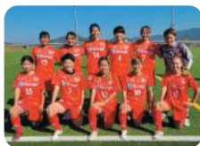
エナジック 琉球デイゴス