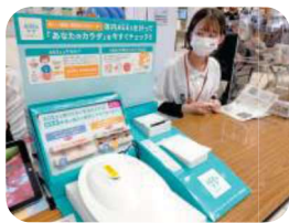
健康測定 (Inbody・血管年齢・体内AGEs) 名桜大学ヘルスサポート