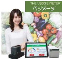
野菜足りてますか? 指1本で簡単チェック 『ベジメータ®』