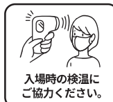
入場時の検温にご協力ください。